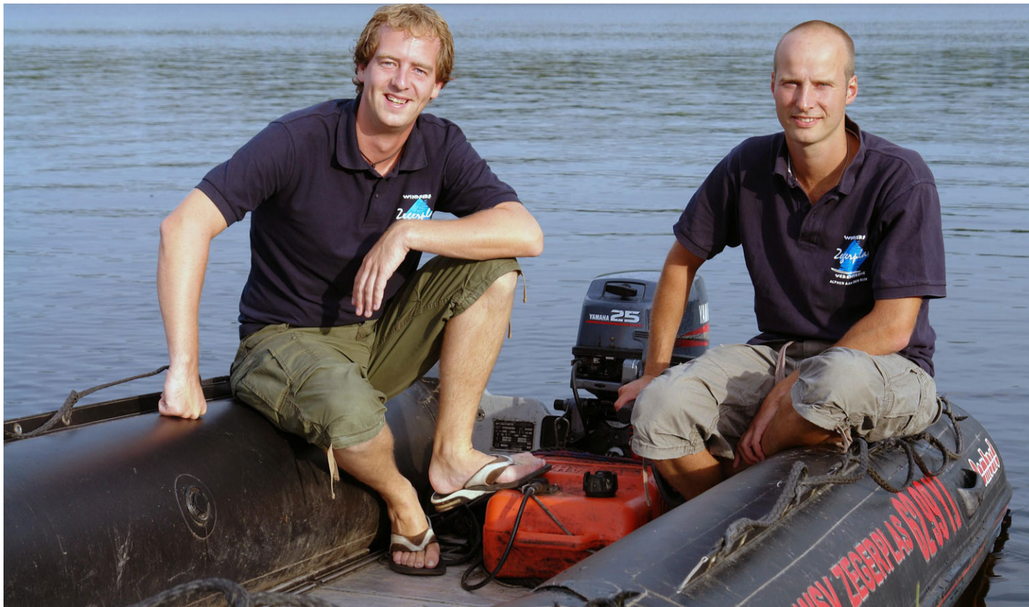
bijschrift tag with dummy text.